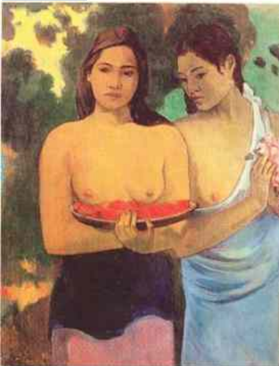
Dos Mujeres Tahitianas Oleo sobre Lienzo Paul Gaughin

Información, controles periódicos y adelantos científicos aportan a la calidad de vida.