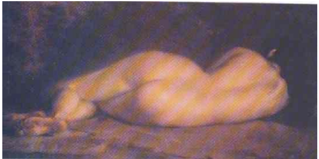
Desnudo Oleo sobre Lienzo Eugenio Zerda

Se enfatiza en reducci3n de desigualdades de g3nero y defensa de los derechos sexuales y reproductivos.