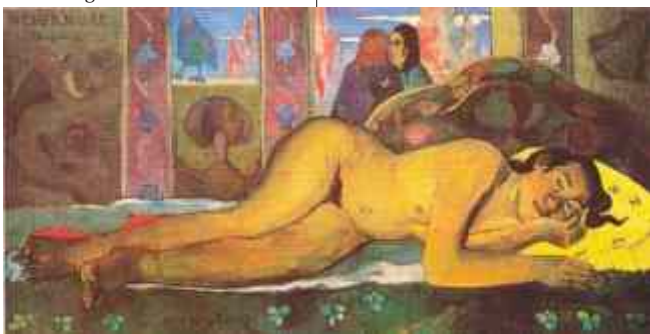
Novermore oleo Sobre Lienzo Paul Gaughin

* Coordinador Nacional Proyecto Madre Hijo-a