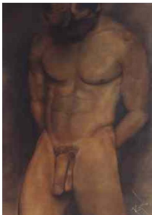
Desnudo Oleo sobre Flanel Rafael Sandoval

Revista "INdetectable Social" es una publicación de carácter científico y educativo. Producida por La ONG Fundación en acción. Bogotá- Colombia www.indetectable.org indetectable@indetectable.org Telefax: 571 3334170 - 5608947 Portada: Obra: Desnudo Técnica: Carboncillo sobre Papel Rafael Sandoval