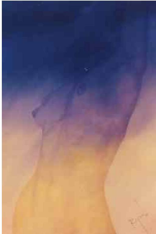
Desnudo Oleo y Acrílico sobre Flanel Rafael Sandoval