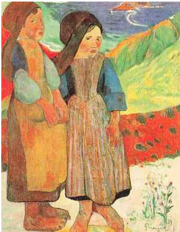
Chicas Jóvenes antes del mar Oleo sobre lienzo Paul Gaughin

La proporción de mujeres infectadas ha aumentado a nivel mundial. En 1997, el 41% de los casos reportados correspondían a mujeres; hacia finales de 2003, cerca de la mitad de todas las personas que viven con vih o sida en el mundo son mujeres. En los países del África subsahariana, el 58% de las personas con vih son mujeres y las menores de 24 años tienen una probabilidad de infección 2,5 veces mayor que los hombres de la misma edad.