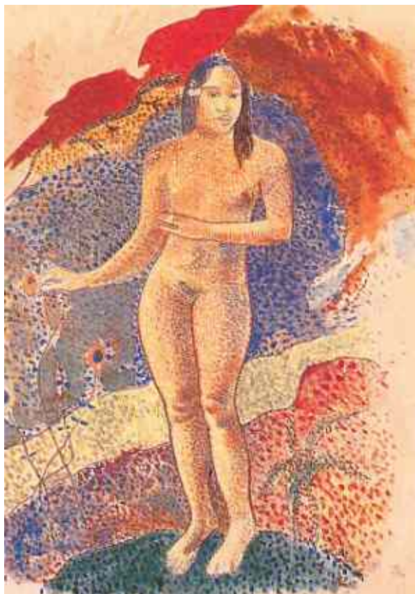
Eva Tahitiana Acuarela Paul Gauguin

La prueba de genotipificación o de resistencia disponible en Colombia Identifica al virus y sus mutaciones, lo que permitirá decidir la mejor terapia en cada caso.