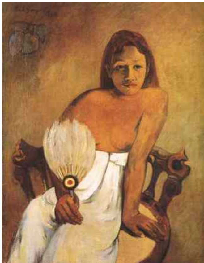
Joven con Abanico Oleo Sobre Lienzo Paul Gauguin

La condición de salud de las personas con vih o sida les hace vulnerables a la exclusión por lo cual el estado debe garantizarles Sus derechos