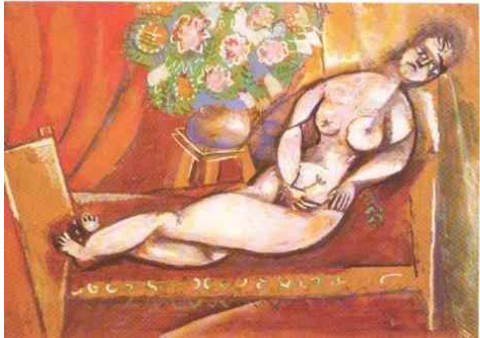
Desnudo Tendido Gouache sobre cartón Marc Chagall

La transformación tiene que darse a partir del rescate de cada quien como agente moral, del reconocimiento de la diversidad y del respeto a los derechos