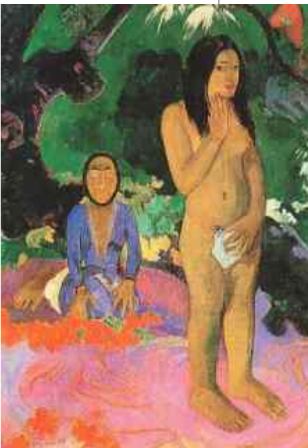
Palabras del Demonio Pastel Paul Gaughin

Algunas organizaciones o personas dicen recoger medicamentos de pacientes que ya no los utilizan (porque su terapia es cambiada, el paciente fallece, o decide dejar de tomarlos, etc.) para entregarlos a quienes los requieren, en realidad no siempre ocurre así, a veces es un disfraz para la compra y venta ilegal, o no cuentan con procesos de control en cuanto a la entrega, la procedencia, intercambio, almace-