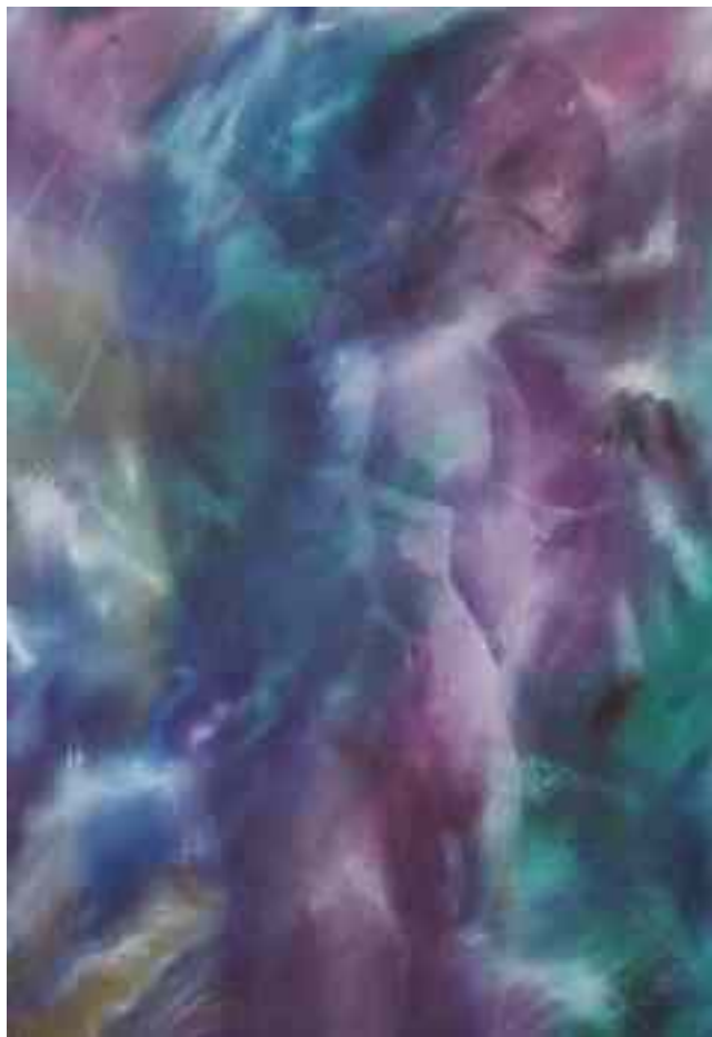
Desnudo Oleo y Acrílico sobre Flanel Rafael Sandoval

ética clave se transforma en ¿Qué he de hacer para permanecer sano? ¿Qué decisión tomar para no hacerme daño a mí mismo/a o a los demás? La respuesta a este interrogante es indelegable y debe ser asumida por cada quien, de forma que la reflexión apunte a la búsqueda del bien personal y comunitario.